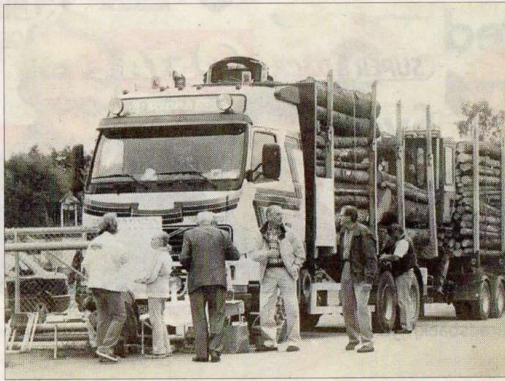
På Lidhultsdagen 199 gällde det att gissa vikten på lasten av timmer. Svaret var 40 ton och en besökare gissade helt rätt.