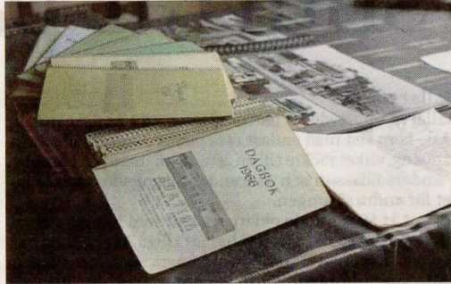
Dagböckerna har blivit många efter ett helt arbetsliv som åkare.