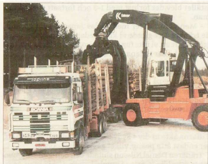
Provyft med en ny truck på Kalmar LMV i Lidhult

- De som känner mig vet att ett av mina stora intressen är Troja Ljungby där jag också är funk-